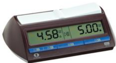
Une pendule d'échecs

Le joueur doit vérifier la position de ses pièces, l'affichage de la pendule, et la couleur des pièces avec lesquelles on doit jouer.